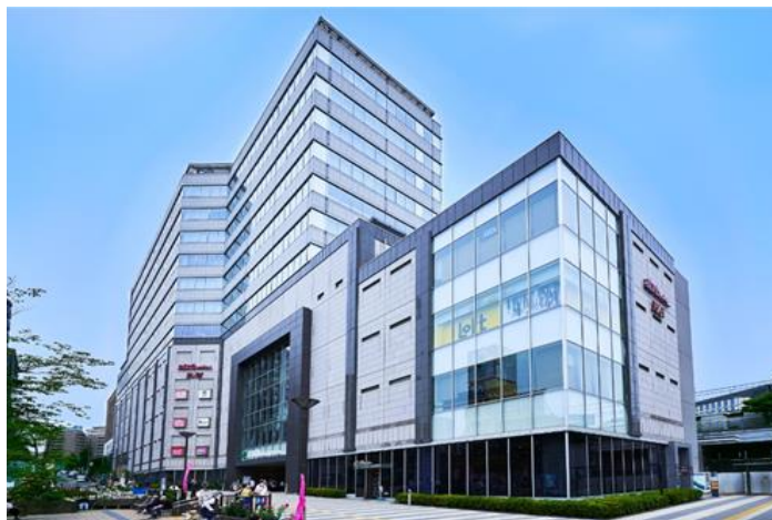
駅直結複合ビル (23区内)